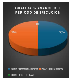
GRAFICA 3- AVANCE DEL PERIODO DE EJECUCION